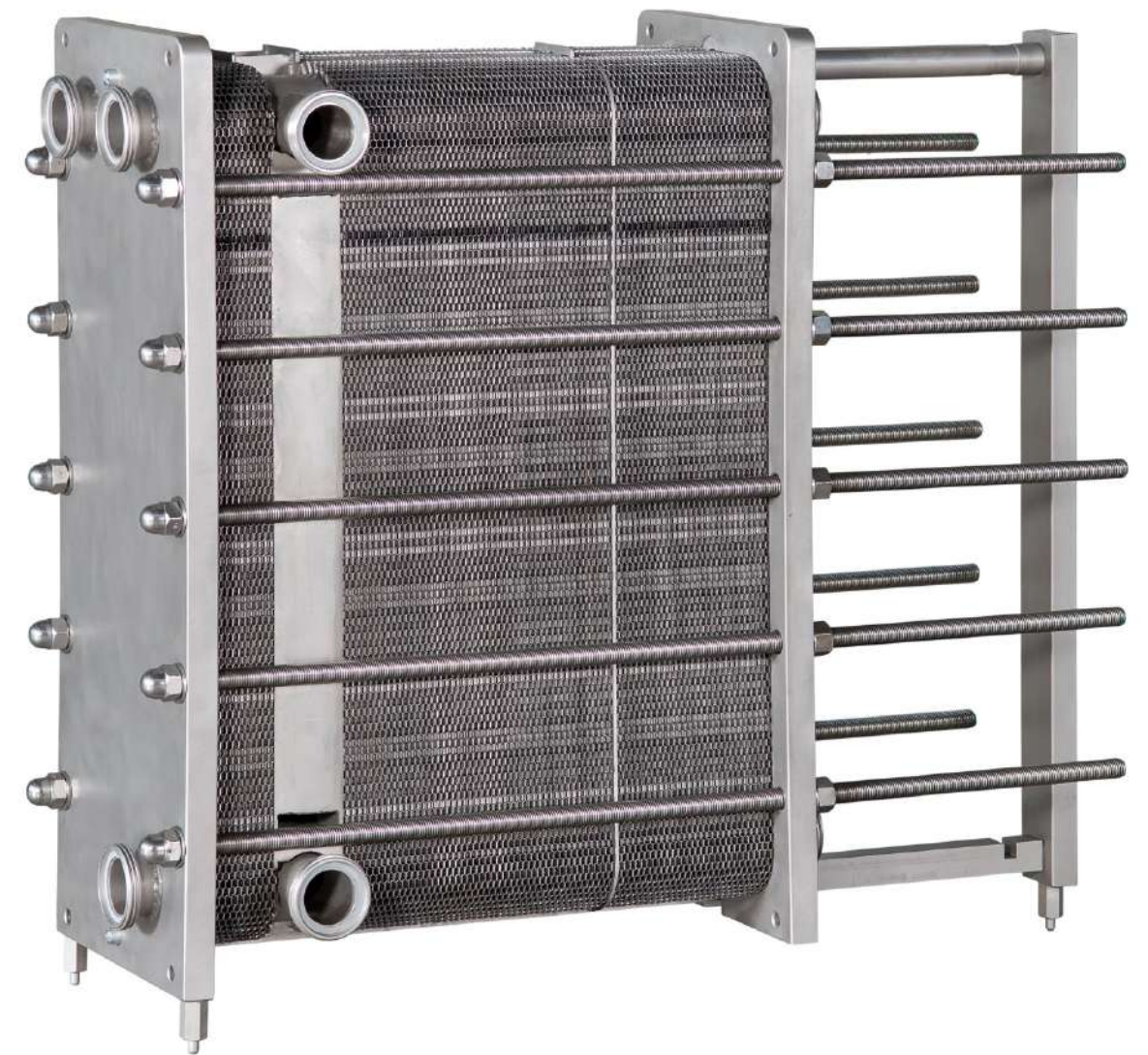
PLATE HEAT EXCHANGERS FOR FOOD INDUSTRY PLATTENWÄRMETAUSCHER FÜR LEBENSMITTEL-ANWENDUNGEN INTERCAMBIADORES DE PLACAS INDUSTRIA ALIMENTARIA ÉCHANGEURS DE CHALEUR À PLAQUES INDUSTRIE ALIMENTAIRE